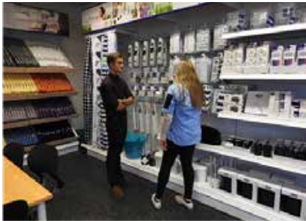
Tradium Business har egen JYSK-Butik på skolen

På Tradium Business lærer du om butikshandel, handel ml. virksomheder og om e-handel i teori og i praksis. Du lærer fagene på en praktisk måde fx i vores egen JYSK-Butik, og du lærer også, hvordan du kan starte din egen forretning, hvis