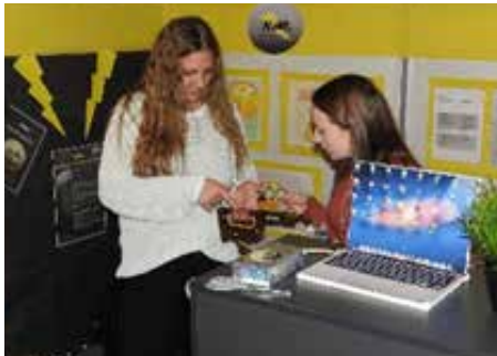
Elever forbereder deres messestand

På Tradium Business lærer du om butikshandel, handel ml. virksomheder og om e-handel i teori og i praksis. Du har mere teori på EUX end på EUD, og du lærer også, hvordan du kan starte din egen forretning,