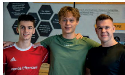
Elever fra HHX til DM i Erhvervs-case