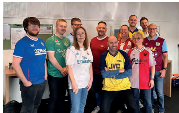
Undervisere klar til #FodboltrøjeFredag

Som elev på HHX har du også mulighed for at dyrke fitness og sport i nye sportsfaciliteter i den såkaldte "Toolbox". Du skal bare have et Tradium-studiekort – så har du gratis adgang alle hverdage!